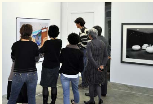
Ici dans l'exposition Cover de Lynne Cohen

4 à 5 ans, à vous d'en décider collectivement!