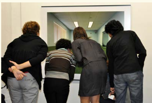
Regarder, voir, observer, découvrir des œuvres ensemble, en exposition ou à l'atelier, c'est aussi cela Les Nouveaux Collectionneurs!

En dehors de ces rencontres, le lien avec le groupe reste régulier. Studio Ganek vous tiendra informé de l'actualité artistique (vernissages, conférences, séminaires, etc.), autant d'occasions pour les membres du groupe de se retrouver de manière informelle!