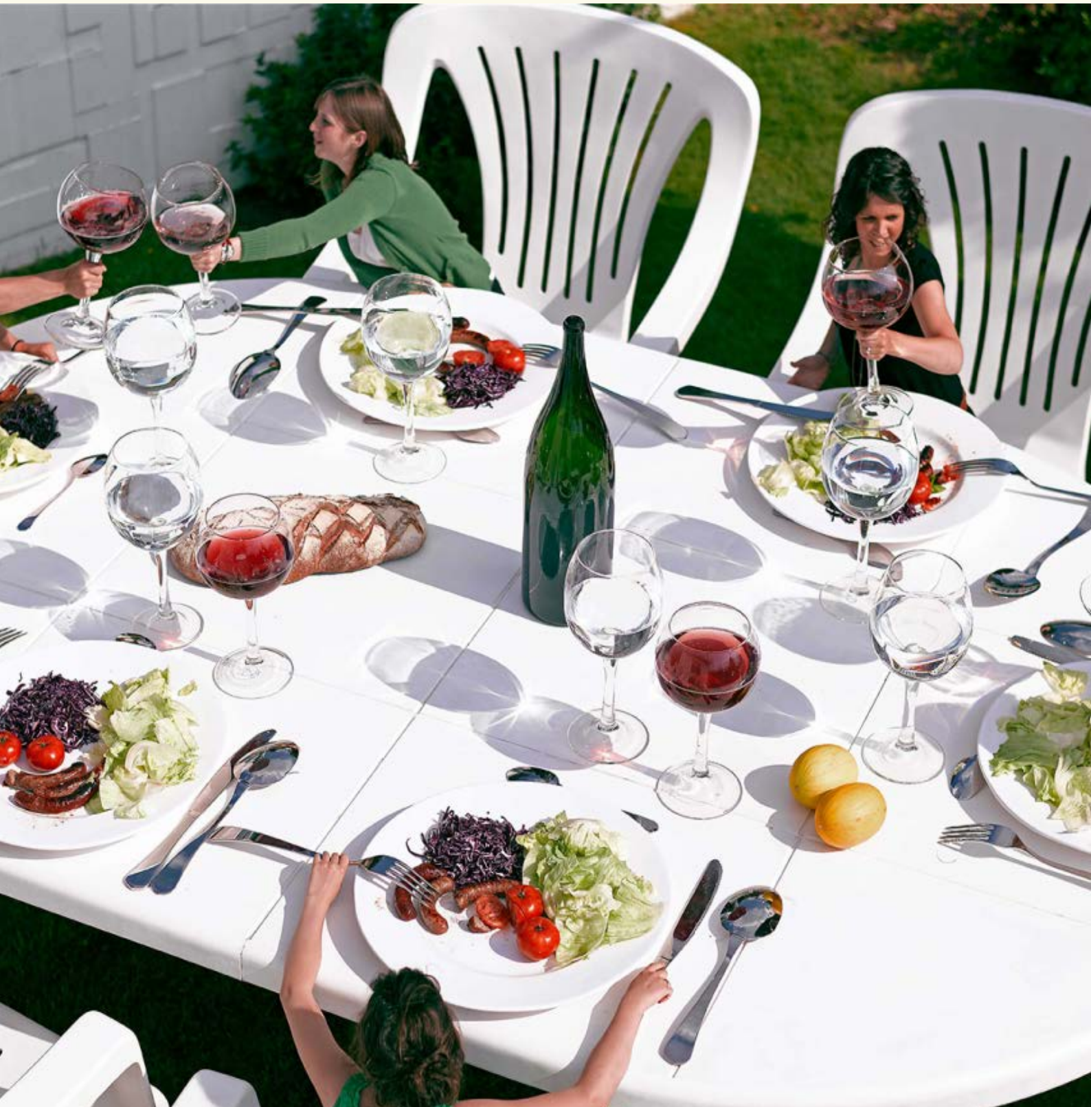
Lilian Bourgeat, Le Dîner de Gulliver, 2014 © l'artiste.